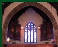
Fotos Skinner-Organ in den USA

Es sind auch weitere besondere Klänge in diesem Orgel-Teil zu hören, wie „Flügelhorn“, „ClaraBella“ oder „Heckelphone“. Dazu sind natürlich auch weitere finanzielle Mittel nötig. Über Unterstützung freuen wir uns sehr.